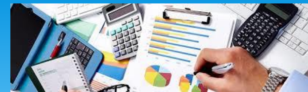
Основни бюджетни показатели по КФП в % от БВП