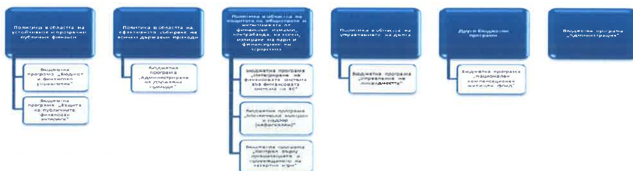
Графика: Области на политики и бюджетни програми по бюджета на Министерството на финансите

По отношение на постигане на ефективност на публичните финанси и дефинираните области на политики и бюджетни програми от програмния си бюджет за периода 2020 - 2022 г. Министерство на финансите ще положи необходимите усилия за постигане на следните цели: